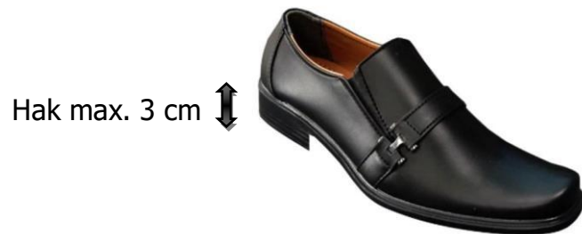
Gambar 1. Sepatu Pantofel