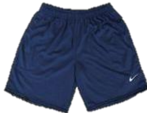
Gambar 8. Celana Pendek