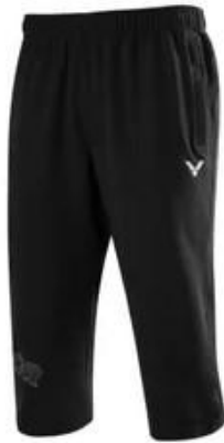
Gambar 5. Celana 3/4