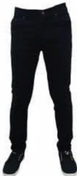
Gambar 7. Celana Pensil