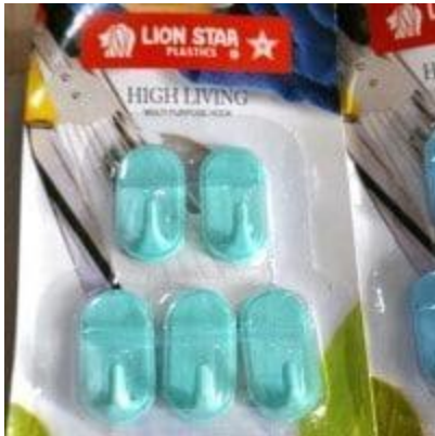
Gambar 2. Kapstok