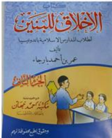
Gambar 5. Akhlak Lil Banin Juz 2 (SMP)