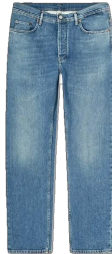
Gambar 6. Celana Jeans