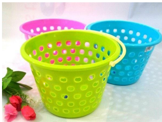
Gambar 4. Wadah Sabun