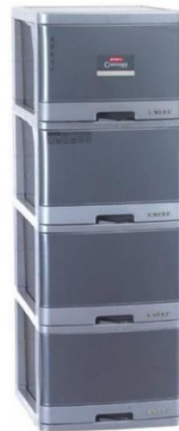
Gambar 3. Lemari Plastik Susun 4